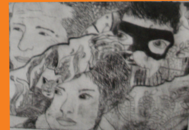
Zeichnung aus BK

Es werden 4 Klassenarbeiten geschrieben: jeweils eine in jedem Trimester und eine Klassenarbeit in BK in der Kurs D-Gruppe.